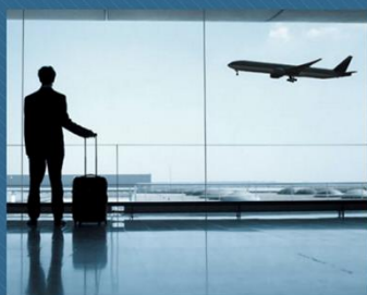
MICE & Business Travel